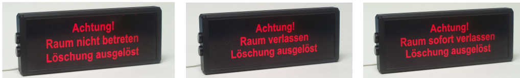
Abbildung der Standard-Ausführungen LWA-90-I ; Text oder Grafik kann kundenspezifisch vorgegeben werden.